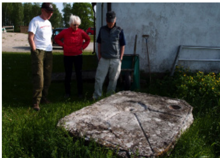
Stenen vid Hejde Kyrka

I Gothem, Sproge och Väte kyrkor finns uttömningsstenar gjorda av återanvända runbildstenar. Lutad mot långhusytterväggen på Klinte kyrka står en rundkantad plint med uttömningshål avsedd för en dopfunt. Liknande plintar finns i andra kyrkor. Piscinor av mindre modell liknande den vid Hejde kyrkas altare, finns i flera kyrkor.